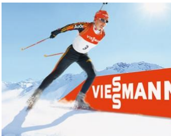
Bild 3: Viessmann bietet seinen Kunden neben einem Komplettangebot innovativer Produkte in Spitzenqualität und einer lückenlosen Dienstleistungspalette auch den Mehrwert einer starken Marke.